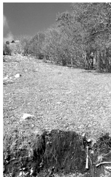
Figura 4. - Faggete su sottili depositi piroclastici coprenti il calcare del Monte Pollino (PZ).

iii) Suoli in delicato equilibrio ambientale. Nella cartografia sono riportati alcuni casi relativi a situazioni relittuali, ad esempio dove sono presenti suoli sottili e vulnerabili derivati da coperture vulcaniche su litologie resistenti all'alterazione e pedogenizzabili solo molto lentamente. L'interesse di questi suoli è dato dal consentire la presenza di particolari associazioni vegetali, quali ad esempio la faggeta, dove il clima e la roccia non ne farebbero ritenere l'esistenza (fig. 4). Fanno parte di questa categoria anche i suoli in equilibrio climacico.