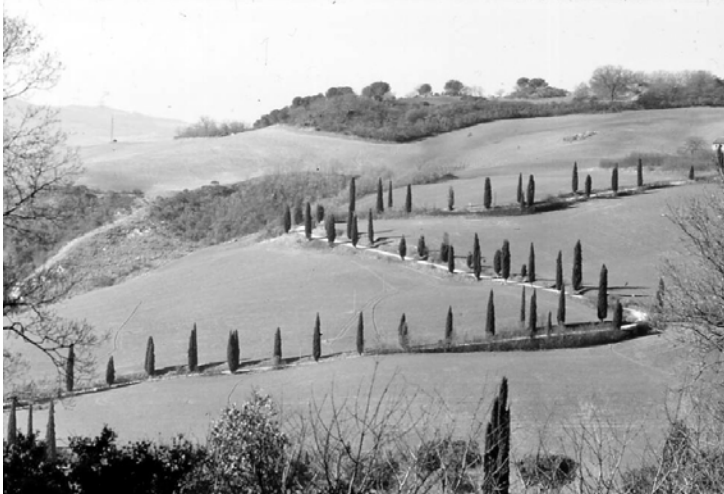
Figura 2. - Pedosito della Val d'Orcia (SI): paesaggio tipico dei suoli Quercia: suoli argilloso limosi, molto calcarei, moderatamente evoluti. Valori: paesaggio culturale. Criteri e classi: raro a scala internazionale, buono stato di conservazione, accessibile in auto, pubblicato.

ii) Suoli come bellezze panoramiche. I suoli possono contribuire alla bellezza di un paesaggio tramite i loro colori. Colori quali il rosso, il grigio e il nero, soprattutto quando contrastanti con le rocce e la vegetazione circostante, creano una scenografia unica che attiva l'interesse dell'osservatore. Un esempio rappresentativo è quello delle terre rosse pugliesi, immerse nel bianco dei calcari e dei casolari (fig. 3).