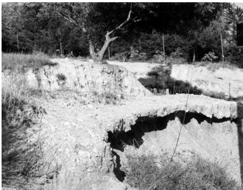
Figura 1. - Paleosuolo con petroplintite, Lacona, Isola d'Elba (LI). Valori: testimonianza paleoambientale. Criteri e classi: raro a scala internazionale, cattivo stato di conservazione, accessibile in auto, segnalato.

i) Paleosuoli. I paleosuoli sono certamente la categoria di pedositi più nota e diffusa. Alcuni profili infatti assumono particolare interesse in quanto conservano la testimonianza di passati ambienti, di processi pedogenetici, geologici e geomorfologici non più attivi, quali, ad esempio, pedogenesi di tipo subtropicale o periglaciale, deposizioni loessiche, eruzioni vulcaniche, eustatismo, cambiamenti climatici. I paleosuoli datati sono particolarmente interessanti perché possono essere usati come marker stratigrafici e rendere più accurati l'inquadramento ambientale e la cartografia dei depositi quaternari (fig. 1).