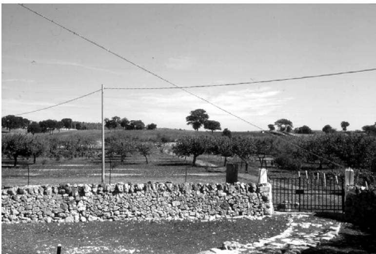
Figura 3. - Lo scenario prodotto dalle terre rosse della Murgia (BA)

ii) Suoli come bellezze panoramiche. I suoli possono contribuire alla bellezza di un paesaggio tramite i loro colori. Colori quali il rosso, il grigio e il nero, soprattutto quando contrastanti con le rocce e la vegetazione circostante, creano una scenografia unica che attiva l'interesse dell'osservatore. Un esempio rappresentativo è quello delle terre rosse pugliesi, immerse nel bianco dei calcari e dei casolari (fig. 3).